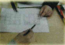
やわらか頭の体操