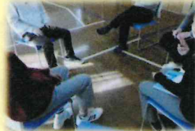
コミュニケーション講座