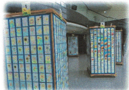
「ひまわりの絵はがき」展示

主催：社会を明るくする運動青少年健全育成大会印西市推進委員会 印西市・印西市教育委員会