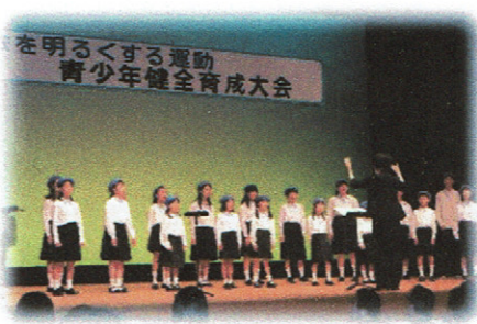
印西少年少女合唱団