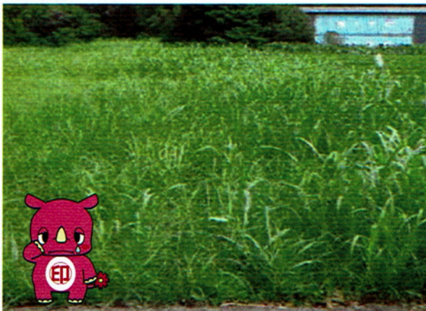
雑草が繁茂し、適正管理がされていない空き地 ※上記は参考画像になります。