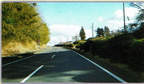
1 成田スマートIC利用時は右車線を走行