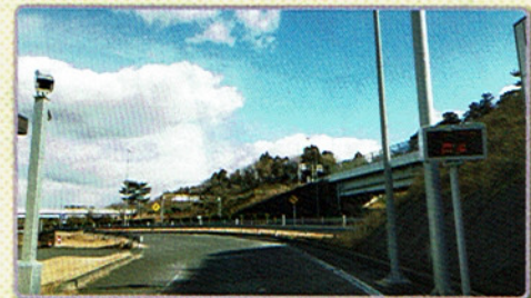
4 ゲートが開いたら、直進して新空港自動車道に合流