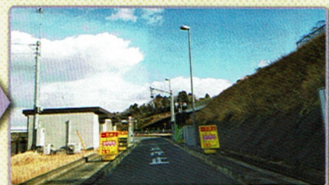
3 ゲートの手前で必ず一旦停止