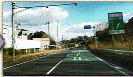
2 緑色のカラー舗装が見えてきたら、まもなく右側に分岐