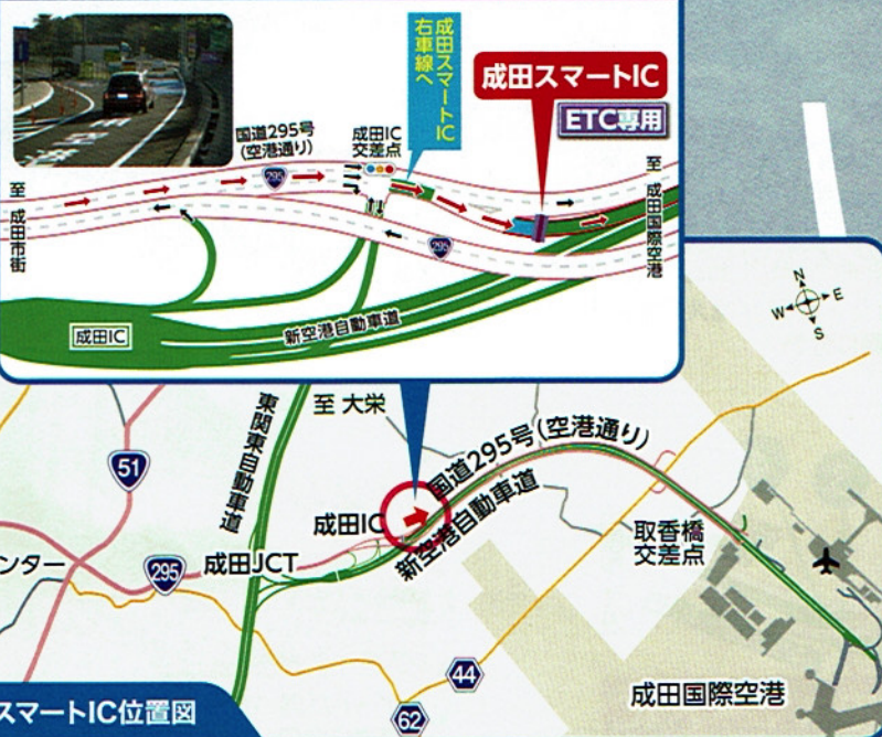
成田スマートIC位置図

※東関東自動車道方面はご利用になれません ※国道295号から成田空港方面への入口のみ